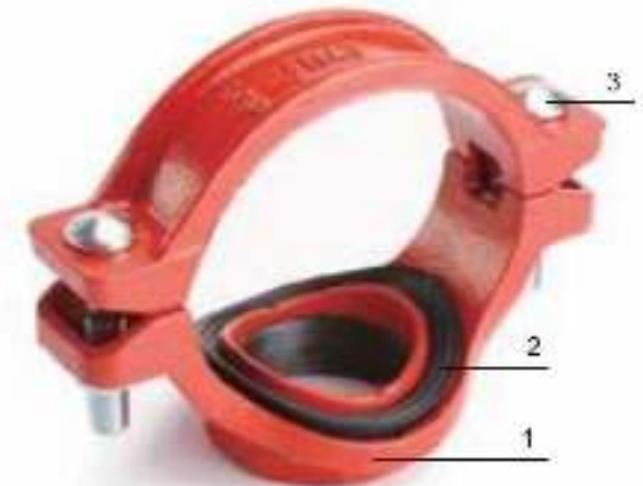
Рис.2. Отвод (седелка) под резьбу «LEDE».