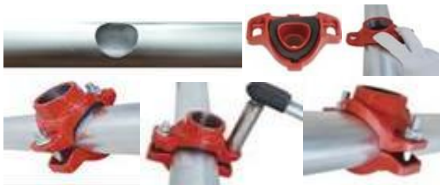
Рис.3. Установка отвода (седелка) под резьбу на трубопровод.